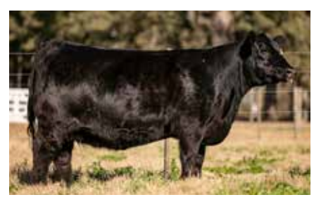
KATE 8345, su hermana materna.