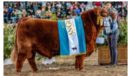
MATEO, su padre.