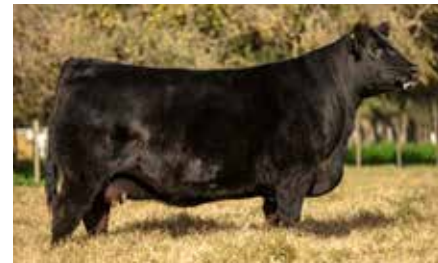
MULATA 7763, su madre.