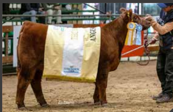
TERCER MEJOR HEMBRA