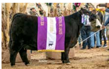
PASIÓN, Reservada Gran Campeón Hembra Palermo 2024.