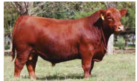
RUBETA GITANO, su padre.