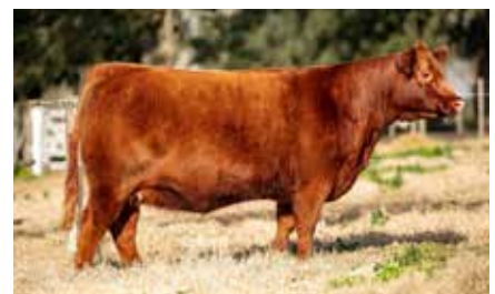
MEDUSA 258, su madre.