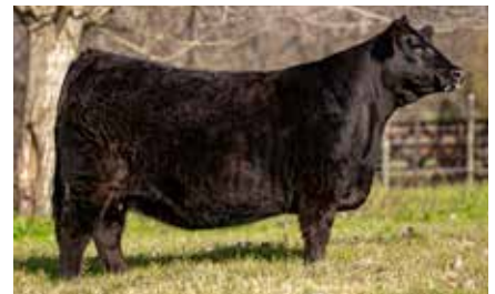
FONTANA 7943, su hermana materna.