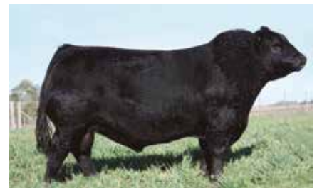
BOMBAZO, su padre.

ERRE TE 383 CONDOR EURO-T/E- RUBETA FONTANA 7409-T/E- RUBETA FONTANA 6207-T/E-