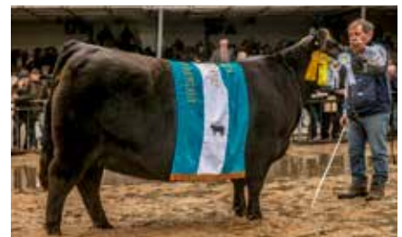
POMMERY, Gran Campeona de Palermo.