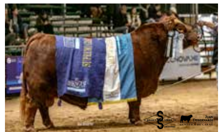
HALCÓN, Bi Gran Campeón y Supremo 2023-2024.