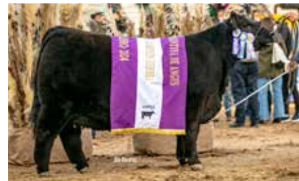
PASIÓN, Reservada Gran Campeón Hembra Palermo 2024, su hermana materna.