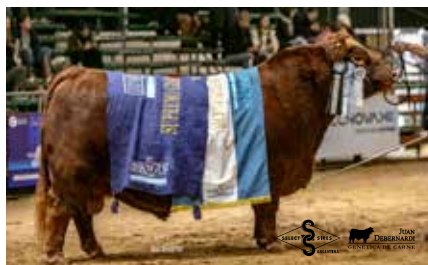
HALCÓN, Bi Gran Campeón y Supremo 2023-2024.