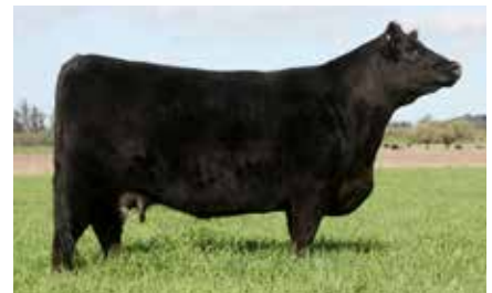
FONTANA 6291, su madre.

TRES MARIAS 6301 ZORZAL-T/E RUBETA FONTANA 6291-T/E- RUBETA 3873 FONTANA-T/E-