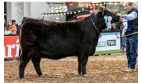
FONTANA 7637, Campeón Vaquillona Menor Palermo 2023.