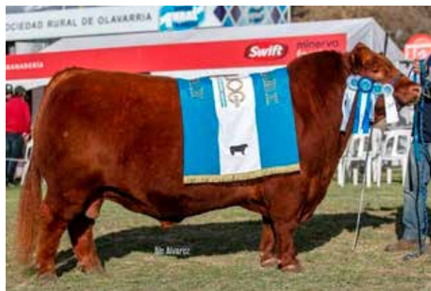
ESCORPIÓN, padre de los embriones.