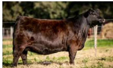
BLACKCAP 8622, Mejor Hembra de Lotes Primavera 2023, su propia hermana.