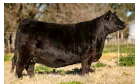
BLACKCAP 8744, lote cabeza vaquillonas La Rubeta 2024.