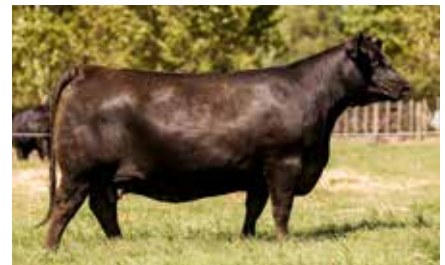
FORJADORA 8113, su madre.

COSENZA DON ROBERTO 338 -T/E- RUBETA FORJADORA 8113 -T/E- RUBETA 4625 FORJADORA -T/E-