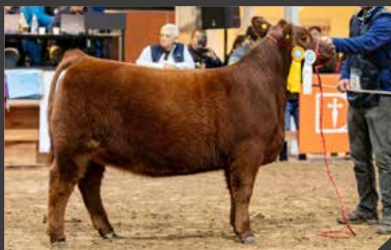
TERCER MEJOR TERNERA MENOR