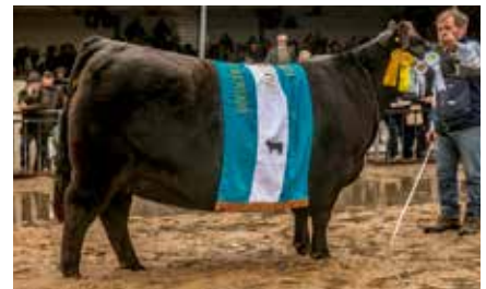
POMMERY, su madre.