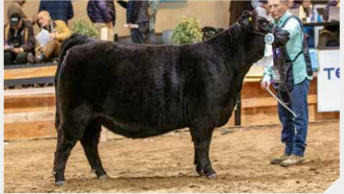
Reservada Campeón Ternera Mayor La Rubeta / La Pasión