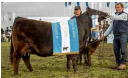
FONTANA 7409, su hermana materna.