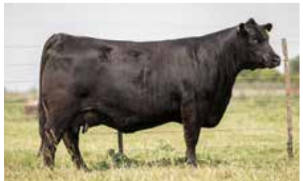
FONTANA 7350, su madre.