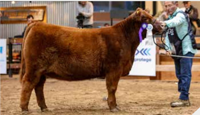
Reservada Campeón Ternera Intermedia La Rubeta / Monino S.A.