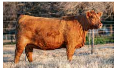
JOVATA 8424, su madre.