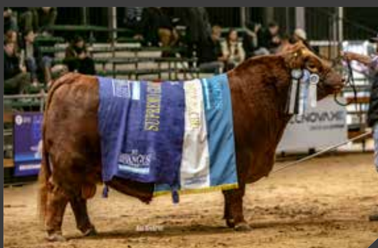
Gran Campeón Macho Supremo 2024