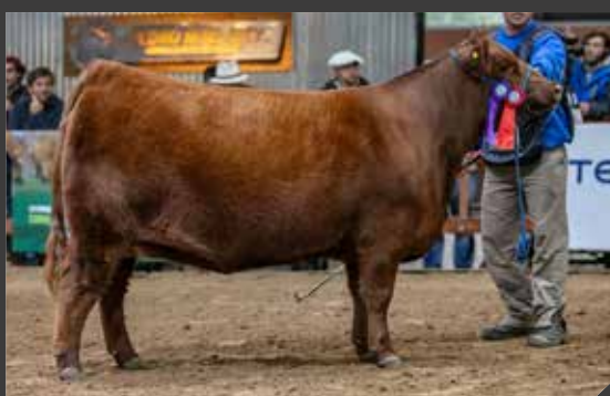
RESERVADA CAMPEÓN VAQUILLONA MENOR