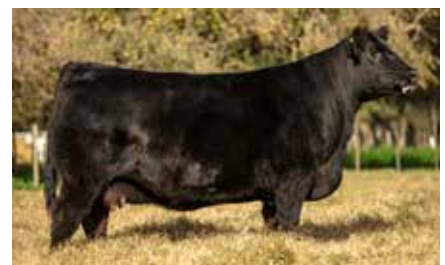
MULATA 7763, su hermana materna.