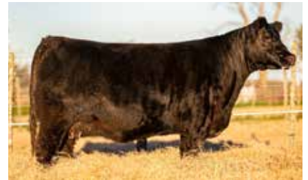
FORJADORA 7653, su madre.