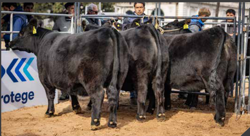
Lote Gran Campeón Hembra Otoño 2024