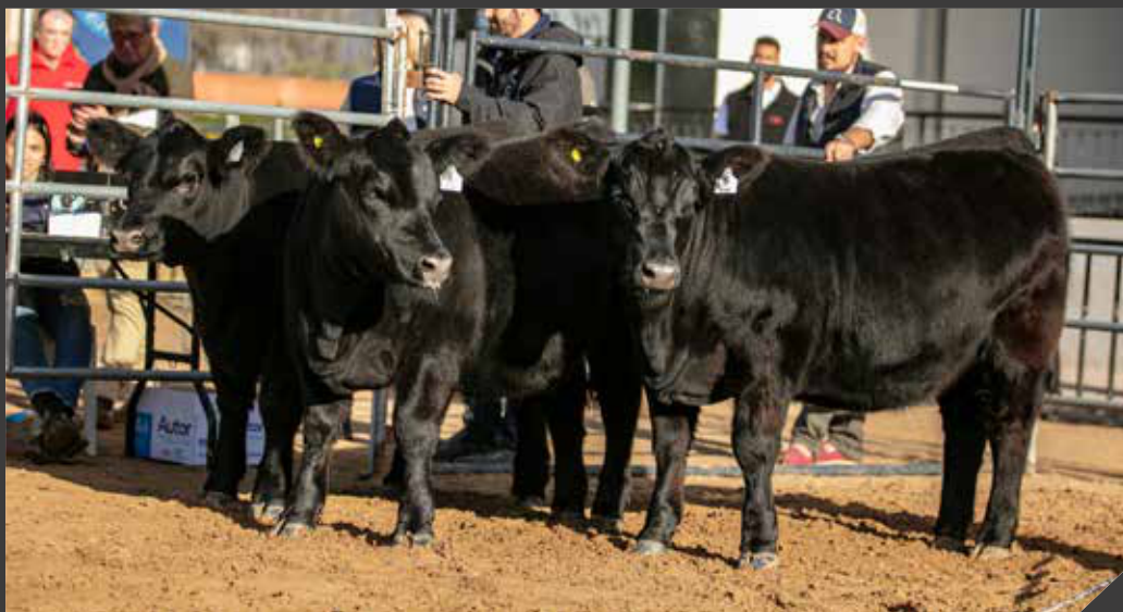
Lote Gran Campeón Ternera Otoño 2023