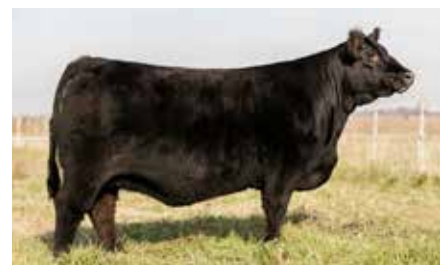
DENIA 7458, su abuela.