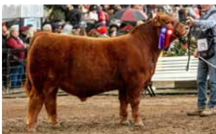
CHIMANGO, Segundo Mejor Ternero Colorado Palermo 2024.