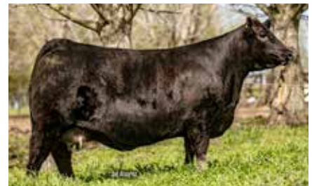
FONTANA TANK, su madre.