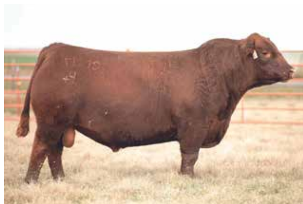
DUFF RED BOXER, padre de los embriones.

MANN RED BOX 55C DUFF RED BOXER 21217 DUFF DIXIE ERICA 1120 1565 RUBETA 4444 QUEBRANTADOR-T/E- RUBETA HEIDI 7189-T/E- RUBETA 3414 BOMBA-T/E-