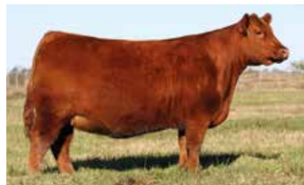
MESITA 6593, fundadora de esta familia.