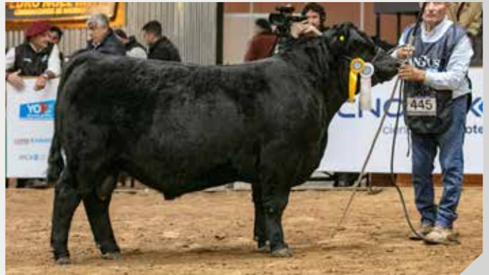
3° Mejor Ternero Mayor La Rubeta / La Pasión