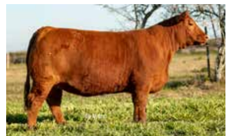
1292, su hermana materna.