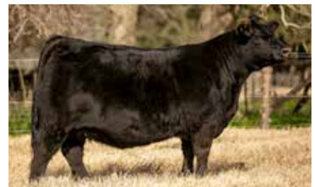
BLACKCAP 8119, su madre.