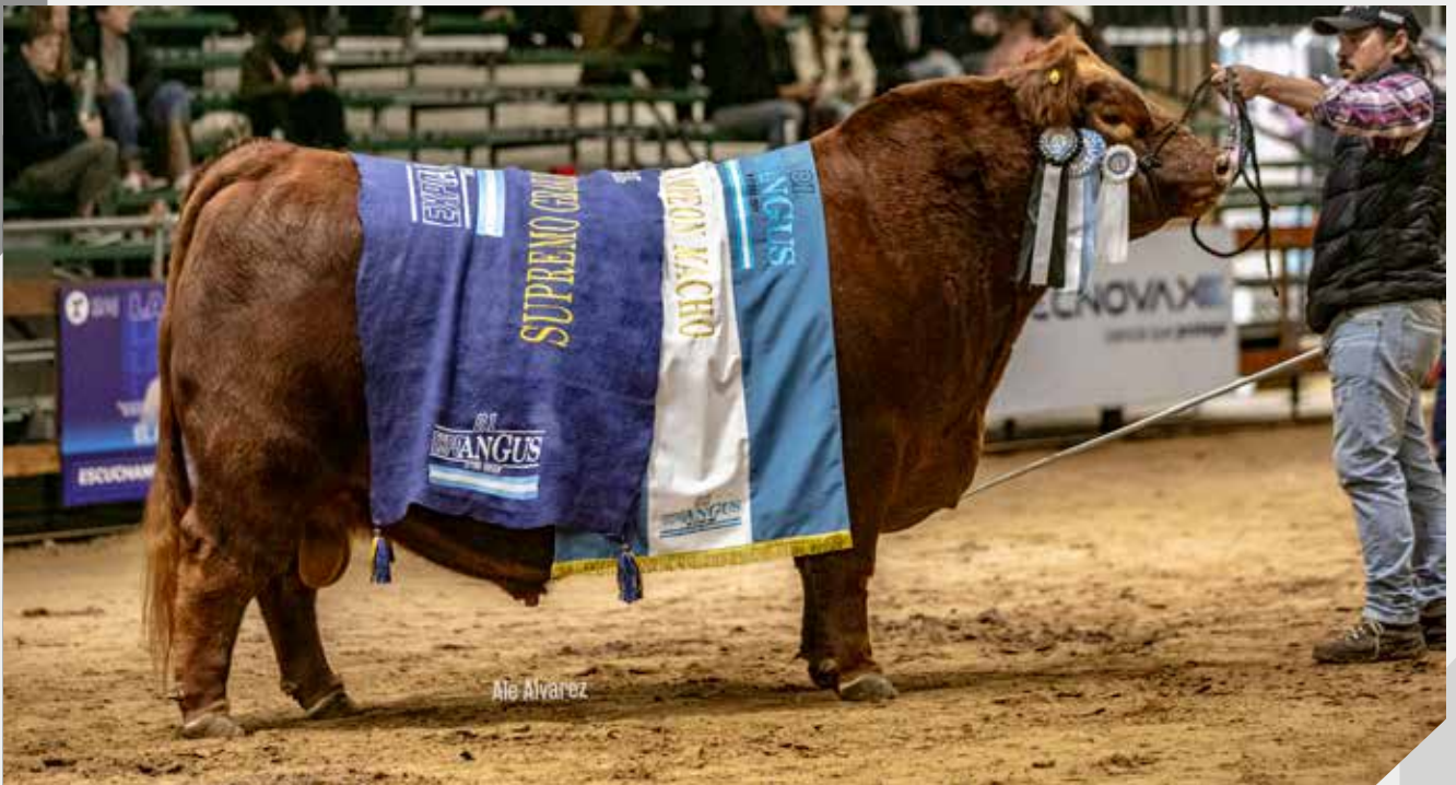
Gran Campeón Macho Supremo y Gran Campeón Macho Colorado La Rubeta / Gustavo Mato / La Pasión / Frig. Modelo

Gracias a nuestro equipo y a nuestros socios que nos acompañan siempre.