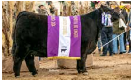
PASIÓN, Reservada Gran Campeón Hembra Palermo 2024, su hermana materna.