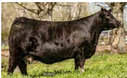
FONTANA TANK, su propia hermana.