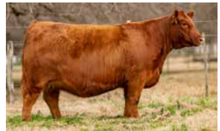
MULATA 8233, su madre, Campeón Vaca Centenario Angus.

SILVEIRAS MISSION NEXUS 1378 RUBETA MULATA 8233-FIV- TRES MARIAS 8522 SAKIC 6978-T/E-