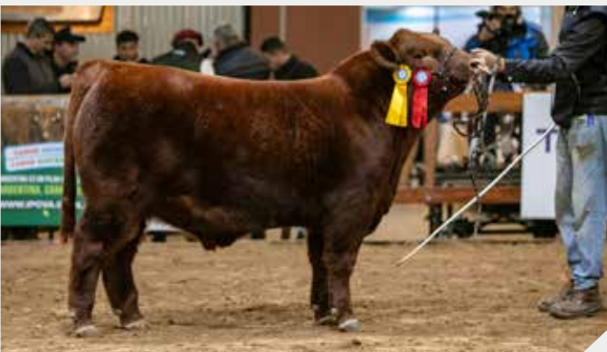
3° Mejor Ternero Intermedio Terragarba / La Rubeta / Frig. Modelo