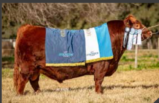
Gran Campeón Macho Supremo 2023