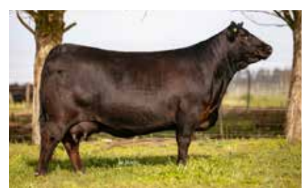
FORJADORA 7586, su madre.

ERRE TE 383 CONDOR EURO T/E RUBETA FORJADORA 7586 T/E RUBETA FORJADORA 5876 T/E