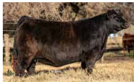
8511, su hermana. Int. Lote Gran Campeón Hembra Lote Centenario.