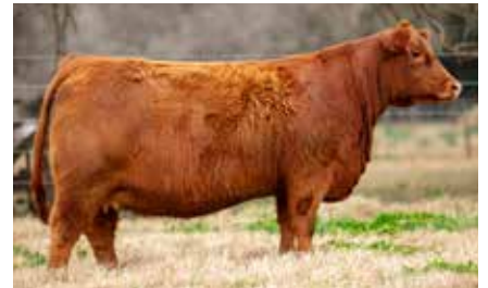
MULATA 8324, su madre.