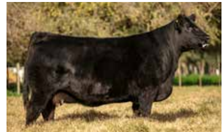
MULATA 7763, su madre.