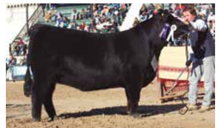
FONTANA 6207, su madre.