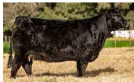
BLACKCAP 8002, su madre.