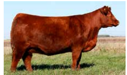
MULATA 6584, su madre.