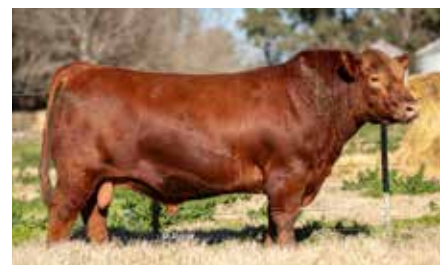
RUBETA 8605, padre de su preñez.