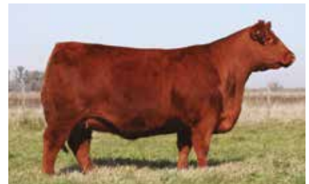
MULATA 6589, su madre.

RUBETA 4444 QUEBRANTADOR-T/E- RUBETA MULATA 6589 -T/E- TRES MARIAS 8522 SAKIC 6978-T/E-