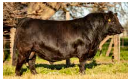
GRAN HERMANO, su hijo.