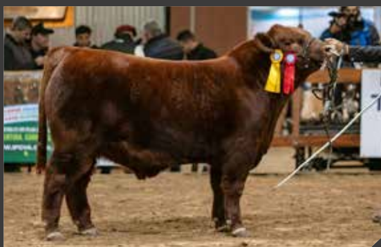
TERCER MEJOR TERNERO INTERMEDIO