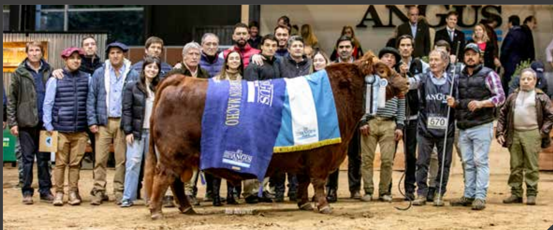
Gran Campeón Macho Colorado 2024