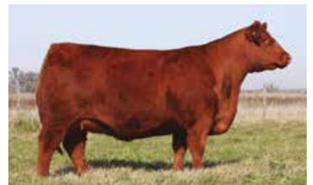
MULATA 6589, su abuela.