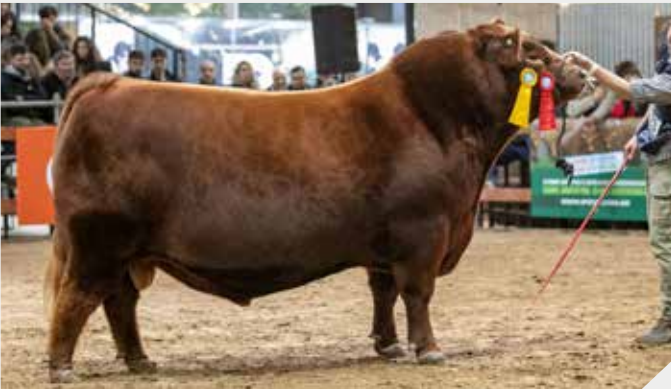
3° Mejor Senior La Cantera / La Rubeta / La Tinta / Frig. Modelo