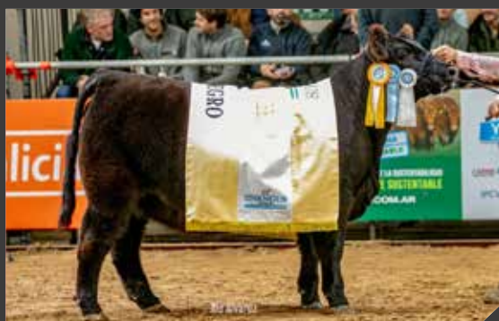
TERCER MEJOR HEMBRA