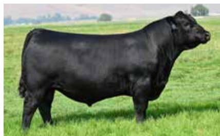
SOUTH AMÉRICA, hijo de Tank en Coleman.