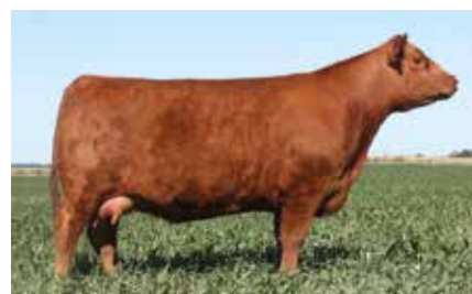
MULATA 8522, fundadora de esta familia.