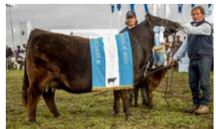
FONTANA 7409, Gran Campeona Nacional, su madre.