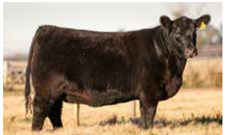
HEIDI 8236, su madre.