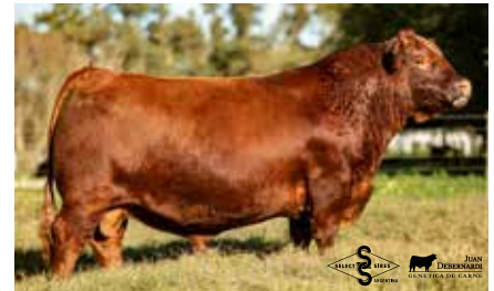
RUBETA PRECOZ, su propio hermano.