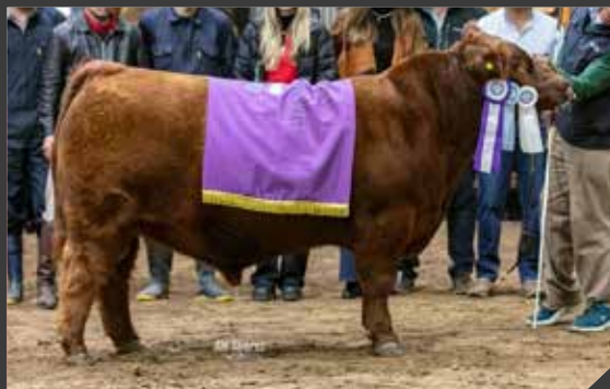
SEGUNDO MEJOR TERNERO