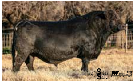
BOTIJA, su hermano.