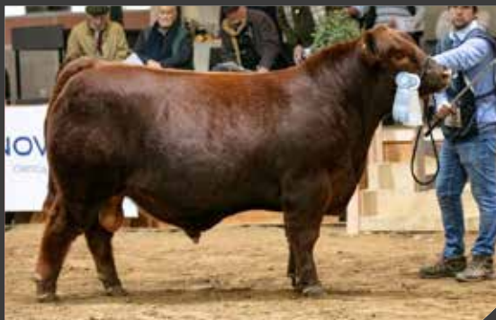
CAMPEÓN TERNERO MAYOR