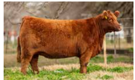
MULATA 8302, su madre.

RED U-2 RECKONING 149A RUBETA MULATA 8302-FIV- RUBETA MULATA 7657-T/E-