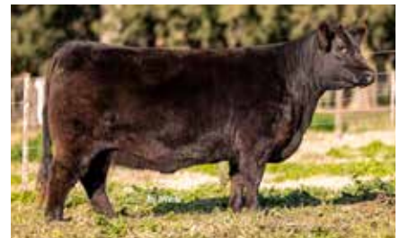
FORJADORA 8755, su hermana materna.