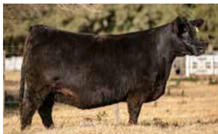
HEIDI 8457, su hija, Integrante del Lote Gran Campeón Hembra Centenario Angus.