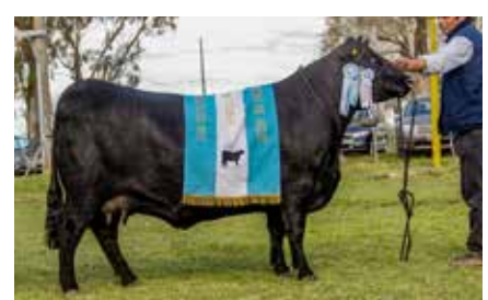
FORJADORA 5876, su abuela.