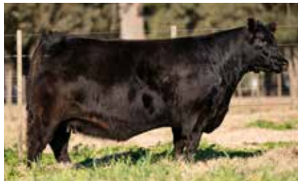
VICKY 8186, madre.