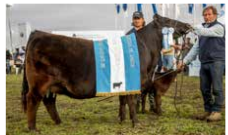
FONTANA 7409, su hija.