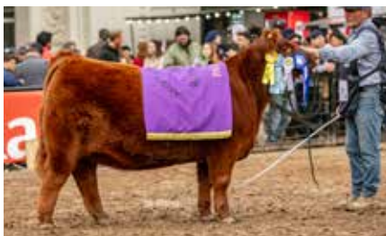
Segunda Mejor Ternera Colorada Palermo 2024.