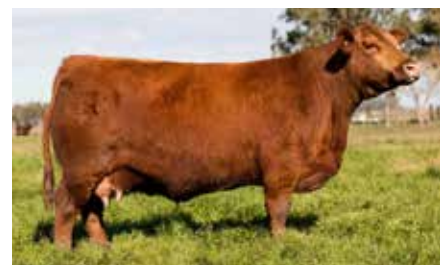
2613 SECRETARIA, hermana materna de la 8020.