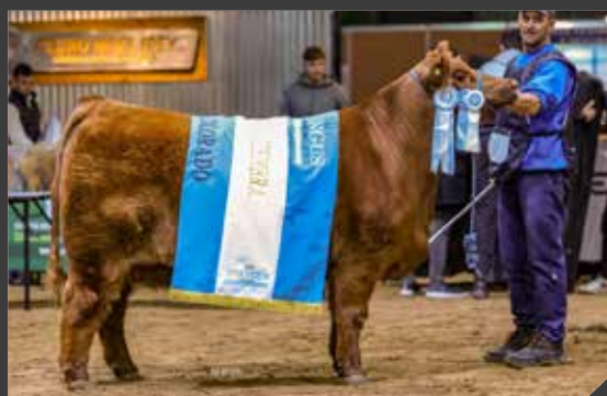
GRAN CAMPEÓN HEMBRA

La Rubeta / Mato Gustavo / La Pasión y Frig. Modelo