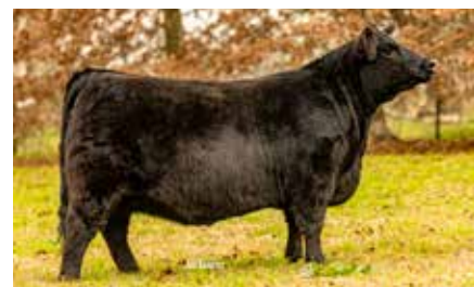
BLACKCAP 8754, su hermana materna.