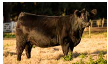
FORJADORA 6564, su abuela.