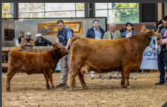
CAMPEÓN VACA JOVEN