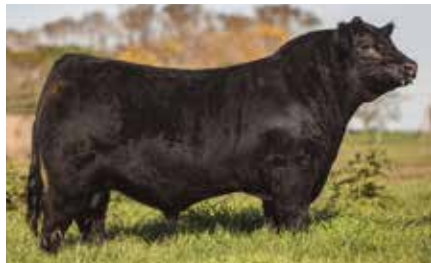
APACHE, su hermano materno.