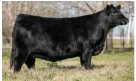
FONTANA 7693, su madre.