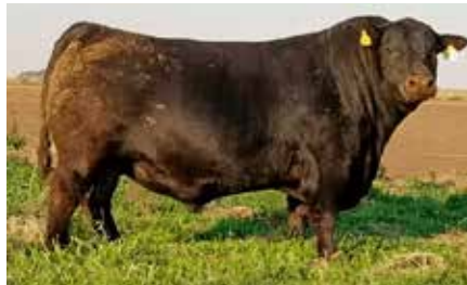
MACANGUS, su padre.

ERRE TE 383 CONDOR EURO-T/E- RUBETA FONTANA 7417-T/E- RUBETA FONTANA 6207-T/E-