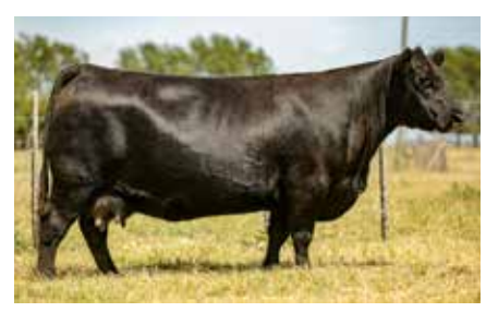
KATE 6298, su madre.