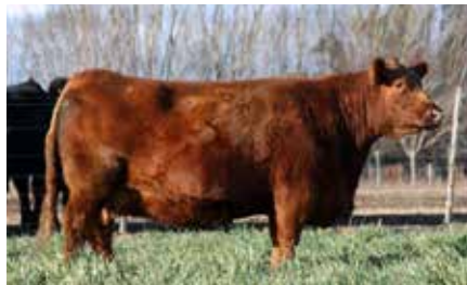
KATE 6700, su gran abuela.