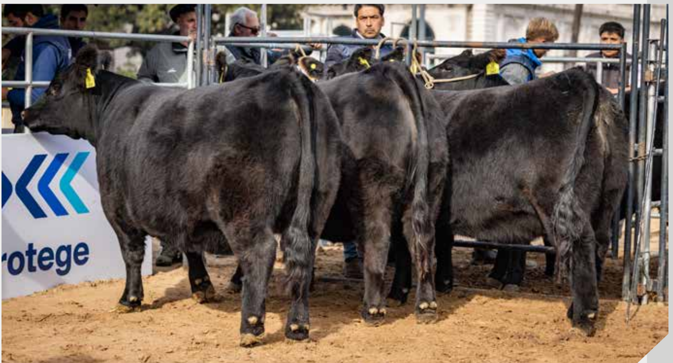
Lote Gran Campeón Hembra, Mejor Hembra de Lote y Segunda Mejor Hembra de Lote La Rubeta / Gustavo Mato / La Pasión