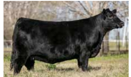
FONTANA 7693, su hermana.