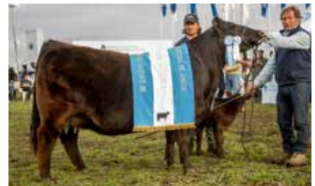
FONTANA 7409, Gran Campeón Hembra Nacional, su madre.

ERRE TE 383 CONDOR EURO-T/E- RUBETA FONTANA 7409-T/E- RUBETA FONTANA 6207-T/E-