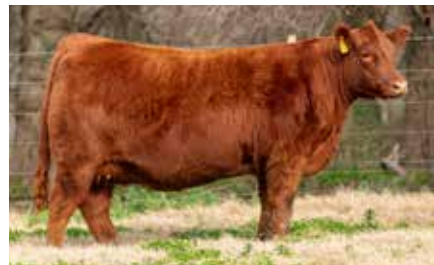
MULATA 8360, su madre.

EC CARLON 509 - PROLIJO RUBETA MULATA 8360 RUBETA MULATA 7657 T/E