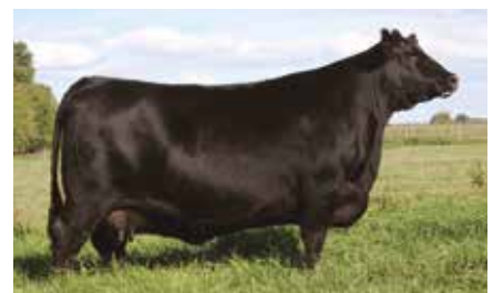
FORJADORA 4625, su abuela.