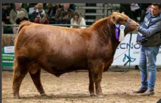
RESERVADO DE CAMPEÓN TERNERO MAYOR