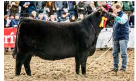
FONTANA 7156, su madre.