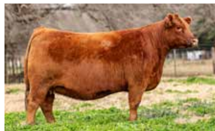
FONTANA 8280, su madre.