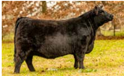
BLACKCAP 8754, su hermana materna.

DON APARICIO SERRUCHO 57 MAXI-T/E- RUBETA BLACKCAP 8119-T/E- RUBETA BLACKCAP 7355-T/E-