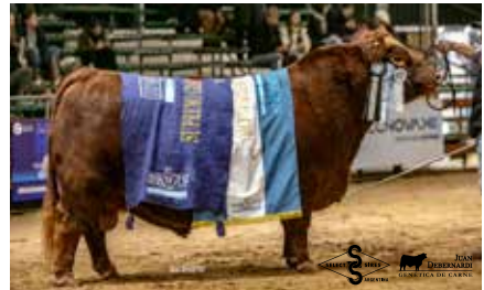
HALCÓN, Bi Gran Campeón y Supremo 2023-2024.

RUBETA 4444 QUEBRANTADOR-T/E- RUBETA HEIDI 7189-T/E RUBETA 3414 BOMBA-T/E-