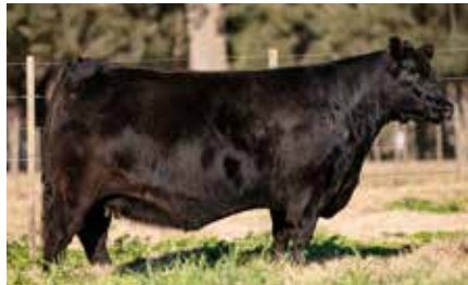
VICKY 8186, su madre.