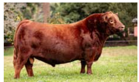
BOTAFOGO, hermano materno de la 8302.