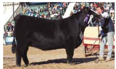
FONTANA 6207, su abuela.