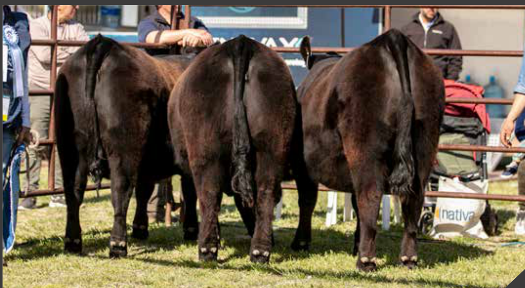
Lote Gran Campeón Ternera Nacional 2023