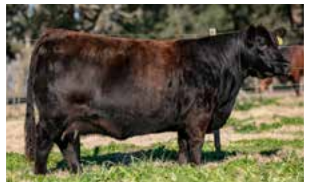
HEIDI 8215, su madre.