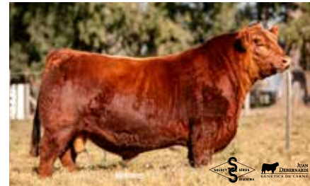
VIRREY, su hermano materno.