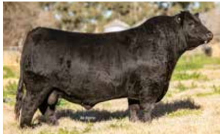
RUBETA 8709, propio hermano Lote 1 LR Venta 2024.

DON APARICIO SERRUCHO 57 MAXI-T/E- RUBETA VICKY 8186 RUBETA VICKY 6254-T/E-