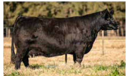
DENIA 8469, su madre.

ERRE TE 383 CONDOR EURO-T/E RUBETA DENIA 8469 T/E RUBETA DENIA 7458-T/E