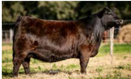
BLACKCAP 8622, Mejor Hembra de Lotes Primavera 2023, su propia hermana.

DUFF DISTINCTION 9105 DUFF NAPOLEON 232 DUFF EUR 443 MERLE 808 ERRE TE 383 CONDOR EURO-T/E- RUBETA BLACKCAP 8002-FIV- RUBETA BLACKCAP 6047-T/E-