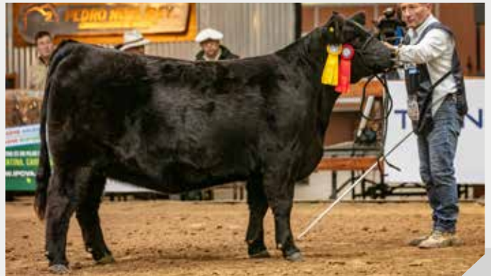
3° Mejor Vaquillona Menor La Rubeta / La Pasión / San Gregorio (Uy)