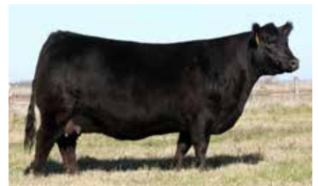
FONTANA 6484, su madre.