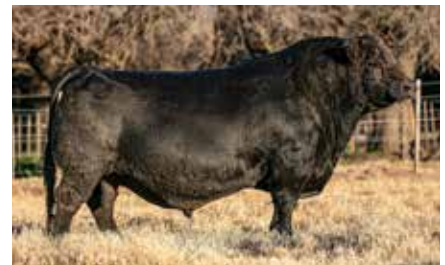
BOTIJA, su padre.