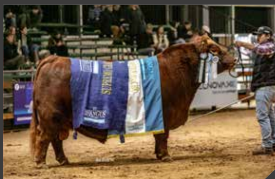
GRAN CAMPEÓN MACHO SUPREMO

La Rubeta / Mato Gustavo / La Pasión y Frig. Modelo