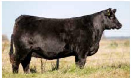
HEIDI 7189, su madre.