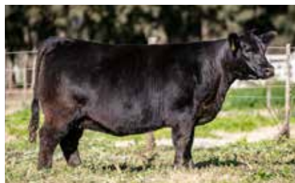
FONTANA 8887, lote destacado venta 2024, su hija.