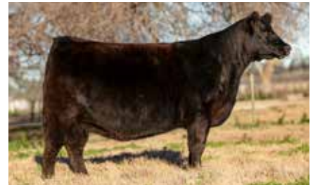
HEIDI 8093, su madre