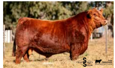
VIRREY, su hermano materno.