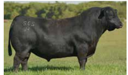
NAPOLEÓN, su padre.