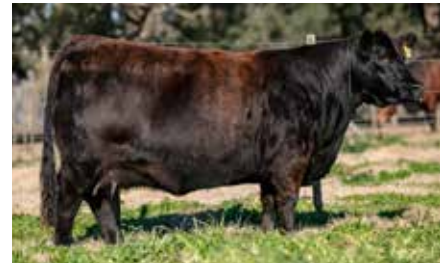
HEIDI 8215, su madre.