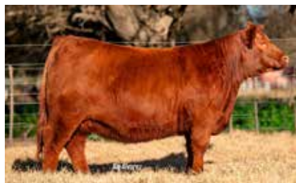
HEIDI 8529, su hija.