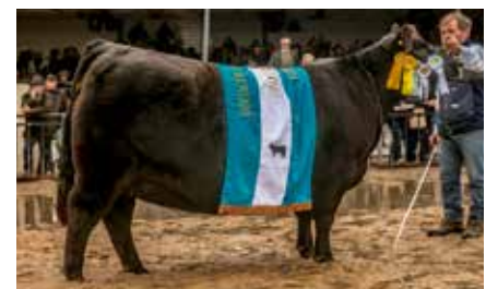
POMMERY, su madre.