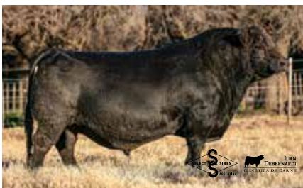
BOTIJA, su hijo.