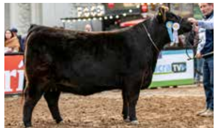
FONTANA 8637, Campeón Vaquillona Menor Palermo 2023.